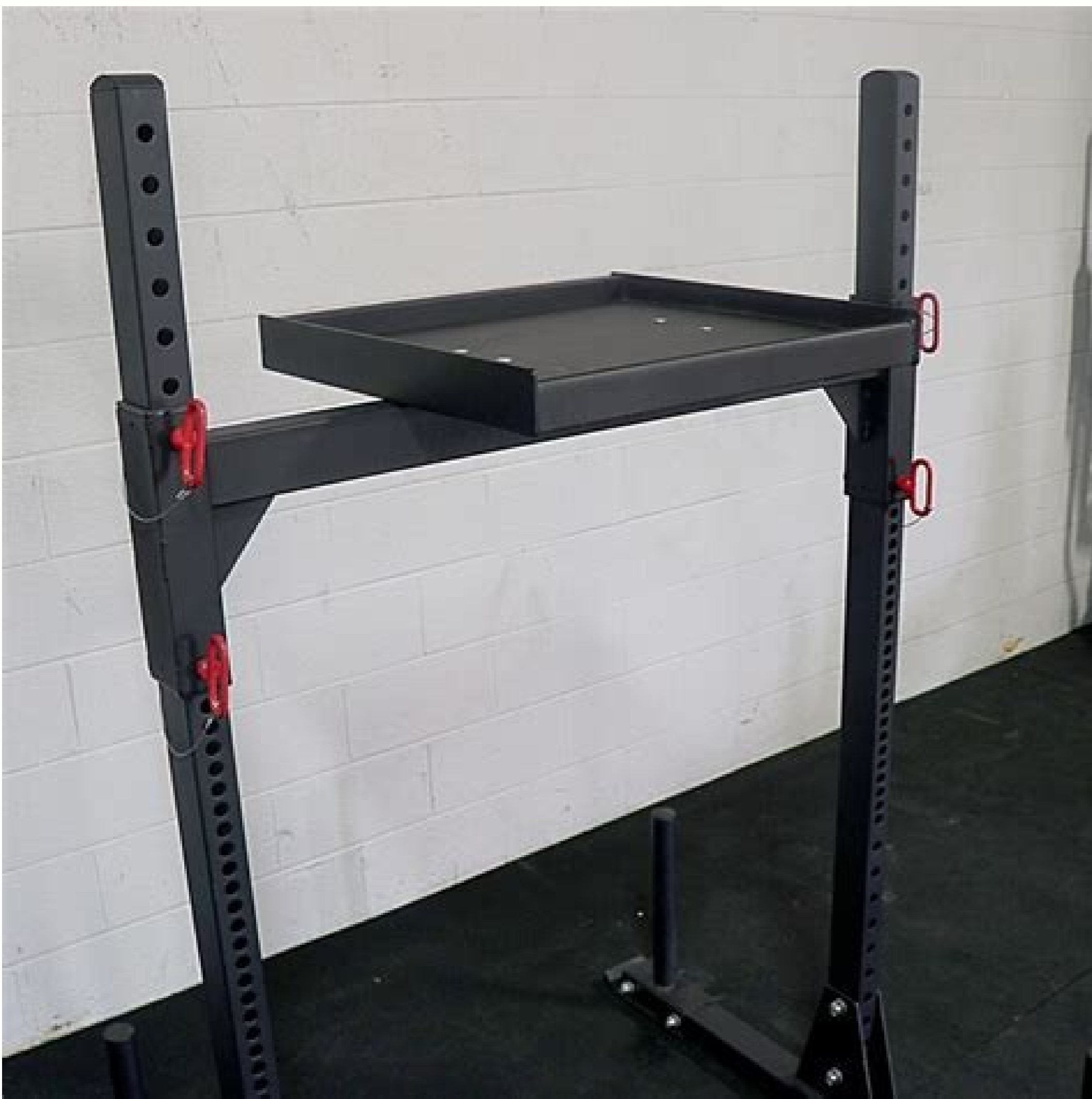
Atlas stone loading platform